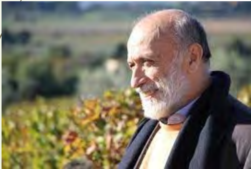
Slow Food Oltrepò Pavese

vivere con equilibrio la nostra natura più profonda di esseri umani.